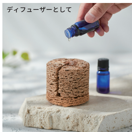
ディフューザーとして