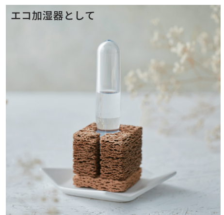
エコ加湿器として